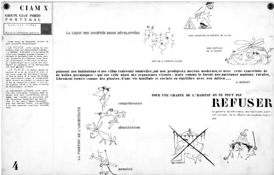
Fig. 1 - GROUP CIAM Porto - Portugal. "Habitat Rural" - Paineil 4 do projeto apresentado no Congresso CIAM 10, 1956.